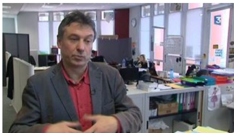
Vers une généralisation du relais téléphonique pour les sourds

C'est la société toulousaine Websourd qui vient de remporter l'appel d'offres gouvernemental. Il s'agit d'une expérimentation initiée par le ministère de la Santé. Pendant un an, 500 personnes de tous âges, souffrant de différents types de surdité, habitant aussi bien en ville qu'à la campagne, vont être équipées du dispositif Elision créé par Websourd.