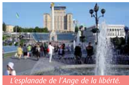
L'esplanade de l'Ange de la liberté.

Il y a une foule d'autres curiosités, musées, palais Mariinsky, Portes Dorées, de très beaux parcs, un Pont des amoureux comme à Florence (c'est-à-dire couvert de cadenas et de rubans accrochés par des couples qui ont voulu symboliser l'éternité de leur amour), et pour les soirées culture, un Opéra extraordinaire. J'y ai enchaîné « Carmen », « Gisèle » et « Madame Butterfly ». Même pour de belles places en hauteur, les prix sont plus qu'accessibles (enfin pour nous). Public chaleureux, niveau des chanteurs (et de l'orchestre) irréprochable. Pourtant, lors d'un entracte, j'ai vu l'horreur aussi, des Français qui occupaient une loge ont sorti soudain des assiettes en plastique, des crudités, du pain, des bouteilles de coke... et se sont mis à manger ! En une minute, tout le monde avait les yeux fixés sur eux. Mais en fait, les gens rigolaient, alors qu'à Paris ou à Vienne, ces quatre spectateurs auraient probablement été mis dehors ! Il est une chose qui reste, dans l'Europe entière, sans équivalent : la fameuse avenue « Khrechatik » - ce sont, en gros, « leurs » Champs-Élysées ! Certains jours à certaines heures, le trafic automobile y est interdit et alors on voit une marée humaine bavarder, rire ou faire de la musique sur ces huit voies auxquelles s'ajoutent les immenses trottoirs, les squares devant les statues d'or grandioses, les fontaines... Ahuri, j'ai plongé.