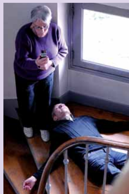
Le texte du dialogue apparaît sur le visiophone 3G.

Ensuite, l'appelant a composé le numéro par l'ordinateur ou le smartphone 3G. Il parlait et l'opérateur répondait en parlant, avec la webcam (caméra sur l'ordinateur). Le texte apparaissait en temps réel sur le cadran du mobile 3G.