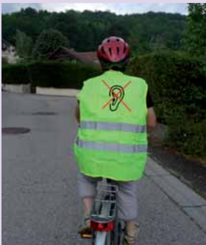
Un sourd qui s'affiche!

Parallèlement, se déroule le projet européen REACH 112 , expérimenté dans 5 pays, dont la France où ce travail a été confié aux partenaires français : CHU de Grenoble, Websourd, Orange, Ivès (support technique).