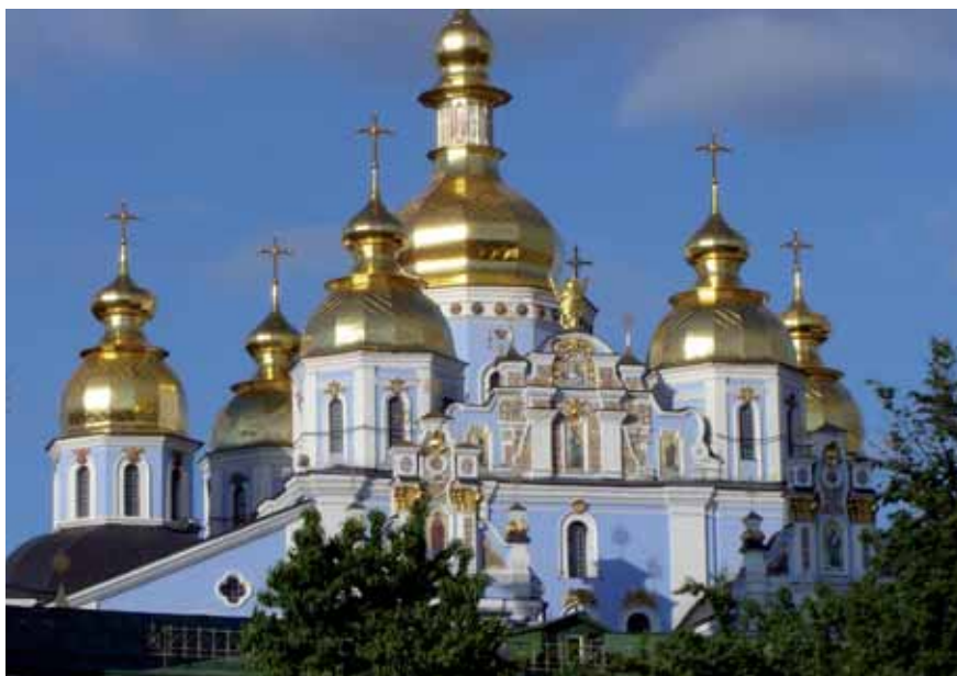
La cathédrale Saint-Michel-aux-Toits-d'Or.