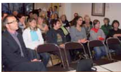
L'assemblée : 50 personnes, quand même !