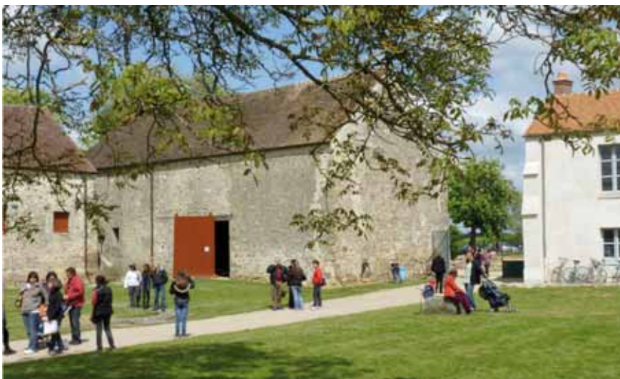
Arrivée aux Granges.

L'association Accès Culture s'est associée avec Les Amis des Granges de Port Royal pour proposer aux personnes sourdes et malentendantes des visites adaptées de l'abbaye de Port Royal (Magny les Hameaux, 78).