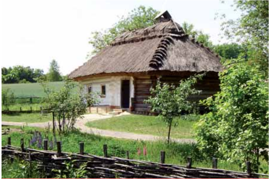
L'école du village.

J'ai l'habitude de manger sur Khrechatik, dans un ou deux restos où l'on goûte l'excellence de la cuisine ukrainienne, leur borchtch, leurs varenikis au chou, à la pomme de terre ou au fromage blanc, et leurs généreuses pâtisseries. Jamais je n'en ai eu pour plus de 4 euros. Et on peut manger à toute heure !