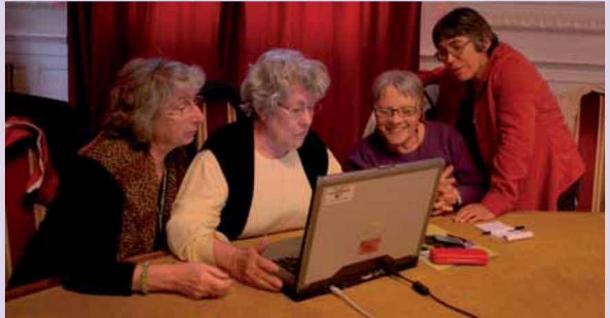
Les volontaires de l'ARDDS 38 au clavier.

Cela comprend toutes les aides techniques à la compréhension, qu'elles soient individuelles comme les micros, les casques télé, les boucles magnétiques de guichet, le sur titrage télévisé, ou collectives comme les boucles d'induc-