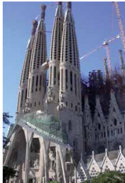
La Sagrada Família de Gaudi, Barcelone.

C'est un service de placement et d'intégration au travail. Une équipe de professionnels spécialisés offre un service personnalisé de conseil et d'orientation : pour rédiger un CV, préparer un entretien d'embauche, trouver une formation adéquate et assurer le suivi lors de l'insertion dans l'entreprise.