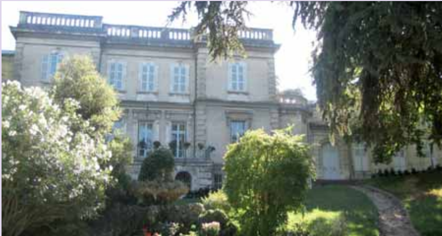
Le château Sainte-Concorde a été construit en 1864 pour un membre de la famille.

Viviers est surtout connue par sa qualité d'ancienne ville épiscopale. Cette petite ville de 3 700 habitants est aussi le berceau de la famille Lafarge, dont certains membres en furent maires de 1897 à 1943.