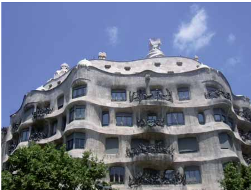
Casa Mila La Pedreda, Barcelone.

L'adhésion à l'ACAPPS (30 € par an) comprend l'abonnement au journal et la participation aux activités dont les cours collectifs de lecture labiale.