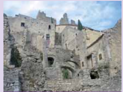
Le village de Saint-Montan.

Des fournitures ou prestations d'entreprises : par exemple Villeroy & Boch a fourni tous les carrelages et assure le secrétariat de l'Association.