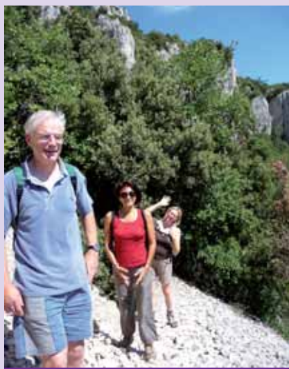
Travers e du pierrier.

Nous avons d cid  de partir nous balader un apr s-midi du c t  de Saint Montan.