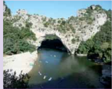
Le Vallon Pont d'Arc.

Et là, tous les commandements me reviennent en tête : comment tenter d'aider quelqu'un par la parole lorsque qu'on est derrière lui, avec le soleil dans le dos, qu'on a de la barbe, qu'on ne tient pas à lui sauter dessus pour le prévenir et tout ça, sans crier? Voici une étrange situation à vivre!